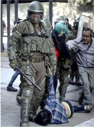
La "reserva moral" de la sofofa en acción.